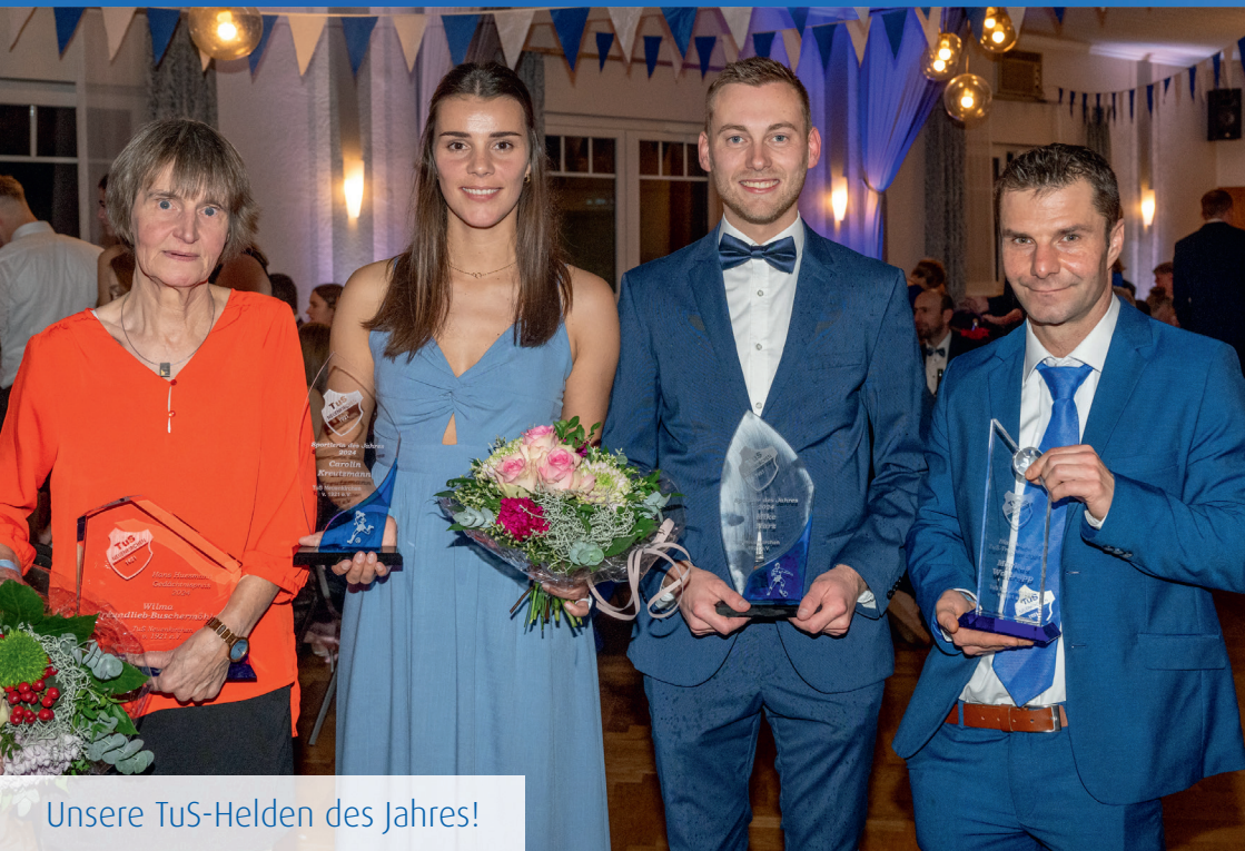
Unsere TuS-Helden des Jahres!